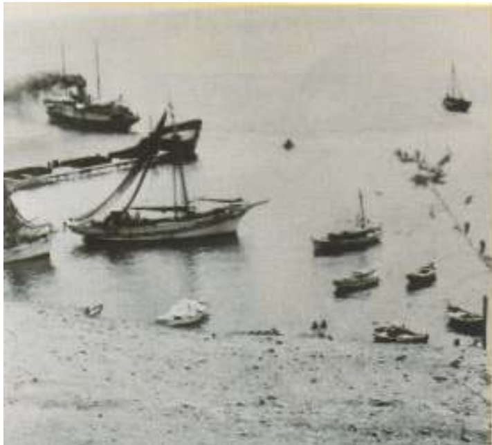
«Κάρυστος» φεύγοντας από τη Ραφήνα, 1947

ΤΗΛ. ΔΙΕΥΘΥΝΣΕΩΣ 41.728 - ΠΡΑΚΤΟΡ. ΠΕΙΡΑΙΩΣ 45.602 - ΠΡΑΚΤΟΡ. ΑΘΗΝΩΝ 30.493 ΚΑΙ ΣΕ ΩΣ ΤΑ ΠΡΑΚΤΟΡΕΙΑ ΤΩΝ ΑΘΗΝΩΝ