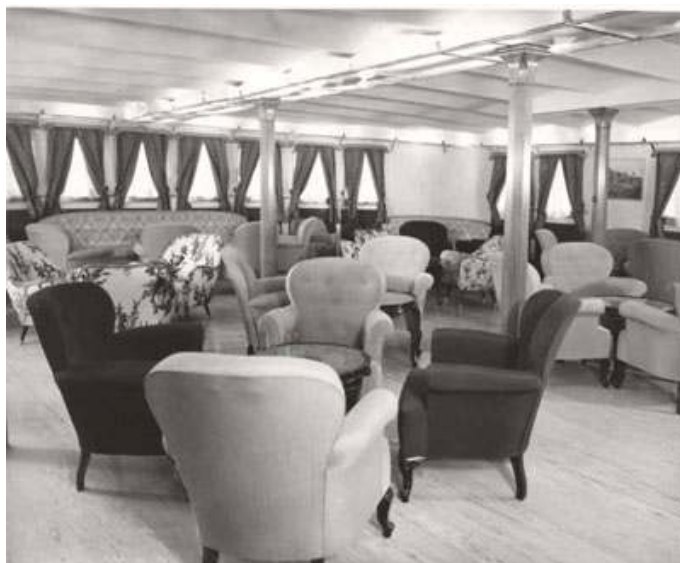
Το σαλόνι του «Κυκλάδες»